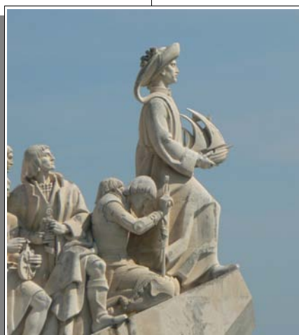
Monuments des découvertes

L'avion paraît s'engager vers d'autres horizons, l'Atlantique, puis dans un demi-tour assez spectaculaire, il reprend la direction du Nord, pour l'aéroport ; nous ne savons pas encore - nous ne le découvrirons que plus tard sur les photos - que la tour de Belém d'où les caravelles partaient pour des contrées