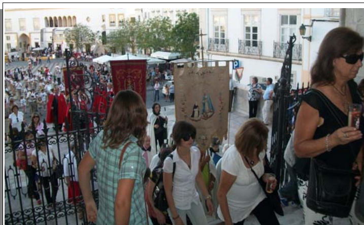
Procession pour la fête de St Matthieu à Elvas

La traversée de la province de l'Alentejo a été assurément pour chacun d'entre nous, un moment enchanteur. Les collines y sont douces, les plaines recouvertes d'oliviers, de chênes-lièges, de vignes