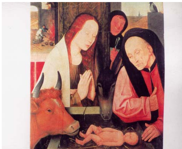
Nativité de Jérôme Bosch

L'enfant qui vient de naître est presque aussitôt déposé par sa mère au meilleur endroit de l'abri de fortune offert au couple pour l'arrivée de leur nouveau-né.