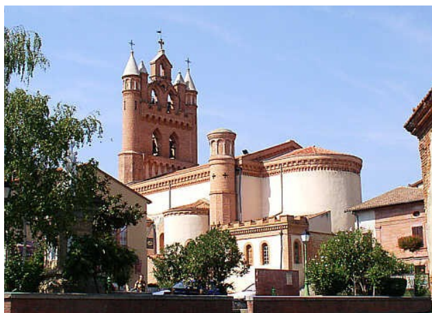
LAGARDELLE : L'ÉGLISE

Il fallait aller se rendre compte ! En route donc, en cette fin octobre, vers Lagardelle sur Lèze au sud de Toulouse.