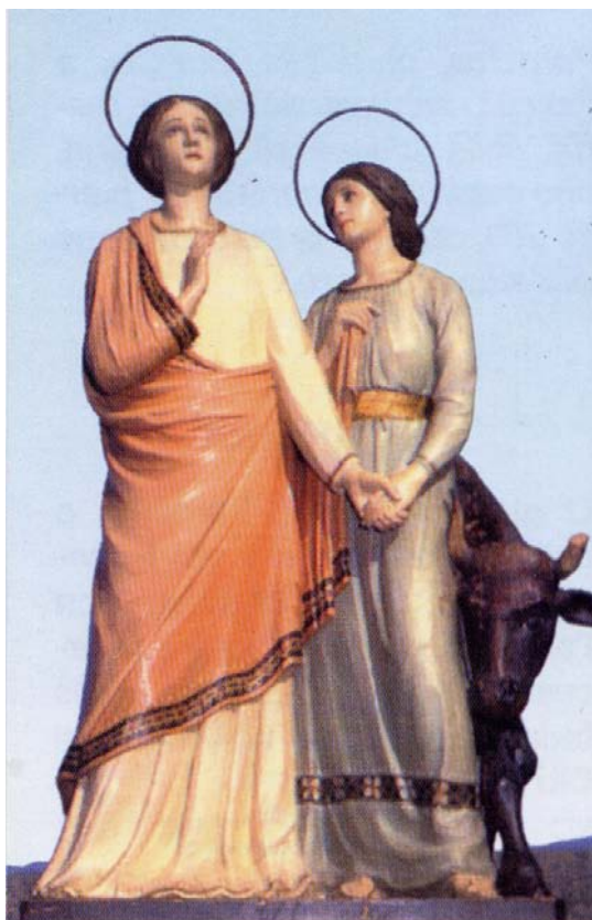
SS. PERPETUA e FELICITA Venerate a SILIUS (CA)

site : http://sainteperpetue.free.fr/sainteperpetue