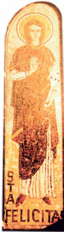
Monastère de Montserrat (Catalogne, Espagne)

La sincérité du récit nous est confirmée par le narrateur, choisi par Perpétue, qui s'estime investi d'une mission. Perpétue se détache donc comme la figure centrale de la Passion , non seulement par son courage tranquille et sa grandeur d'âme, mais aussi par