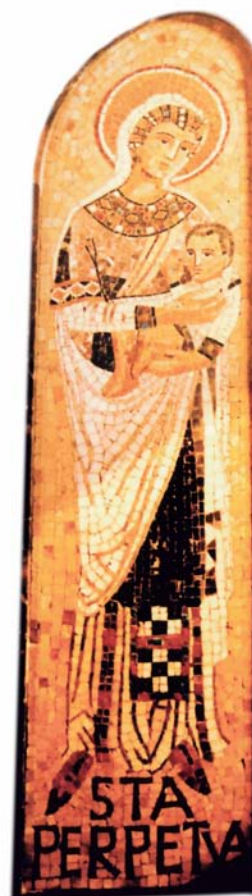
Monastère de Montserrat (Catalogne Espagne)

Perpétue converse spontanément en grec, qui paraît être sa langue maternelle. Elle a fait un beau mariage, ce qui lui vaut le rang patricien de matrone, reconnaissable au port de la stola , robe généralement bordée d'une bande brodée. Sa beauté délicate réussira à émouvoir la foule et, dans l'arène, elle a le réflexe d'une femme élégante, en songeant avant tout à rattacher sa chevelure. Son mari ne peut être qu'un haut personnage ; est-il africain de naissance ou est-ce un magistrat romain ? Les hypothèses ne manquent pas pour expliquer une absence étonnante. Il y a effectivement à Rome une famille patricienne connue, les Vibii. Un haut rang pourrait expliquer