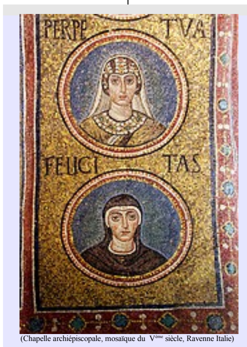
(Chapelle archiépiscopale, mosaïque du V ème siècle, Ravenne Italie)

Que le sacrifice et le pardon de leurs victimes les mènent sur un chemin de conversion.