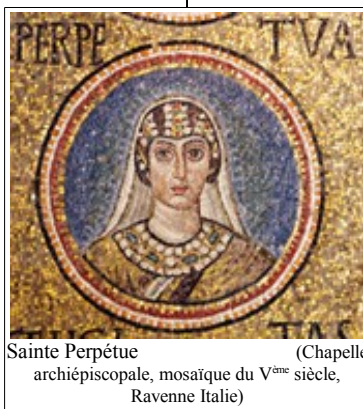
Sainte Perpétue (Chapelle archiépiscopale, mosaïque du V ème siècle, Ravenne Italie)

Ainsi, en sortant de la prison (souterraine) tous ont eu l'occasion de penser à eux : quant à moi, j'ai allaité mon enfant désormais épuisé par la privation; j'étais tellement préoccupée pour lui que j'ai parlé avec ma mère, j'ai encouragé mon frère, j'ai recommandé mon fils. Je me suis tourmentée précisément parce que je les voyais se tourmenter à cause de moi.