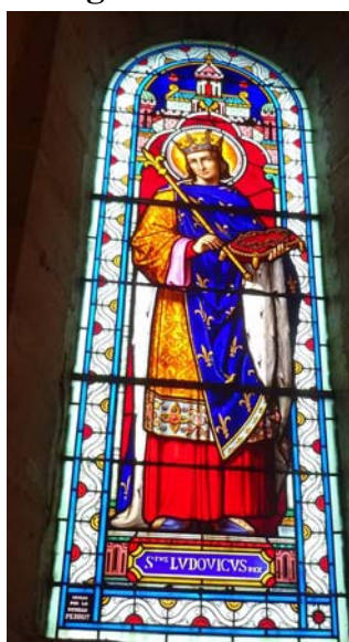
St Louis, Ste Sévère sur Indre

Un descendant de Thibaud, Guillaume, Seigneur de Vierzon accompagna Saint Louis en Palestine d'où ils revinrent en 1250. Il mourut en 1251 et son fils Hervé III, marié à