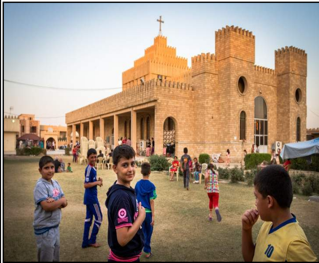
Groupe d'enfants dans le jardin de la cathédrale Saint-Joseph dans le quartier d'Ankawa, à Erbil (Kurdistan irakien), été 2014