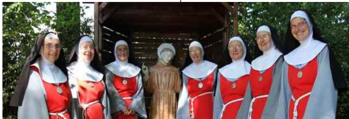
Les sœurs de l'Annonciade de St Doulchard (18)