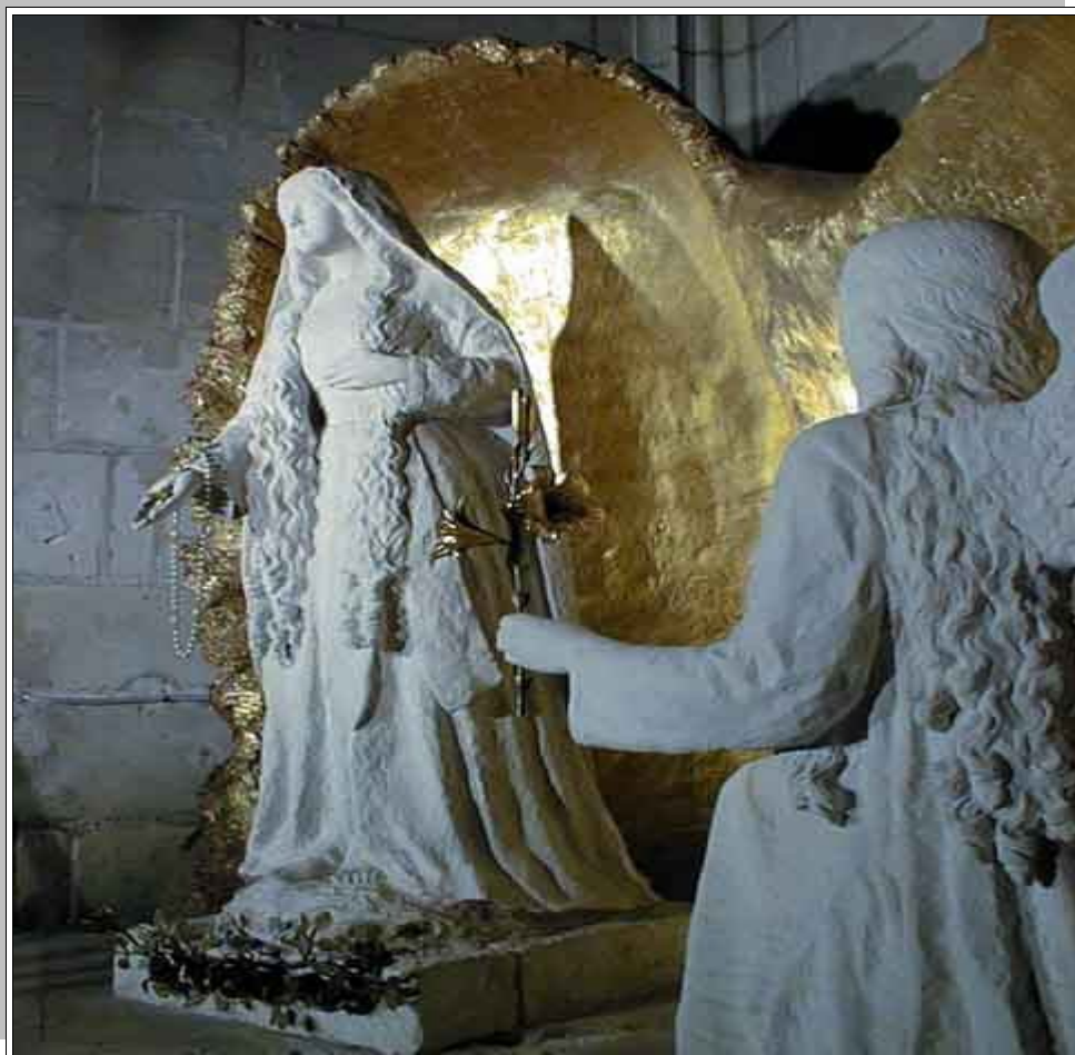
Statue de la Vierge Marie dans l'église St Gilles à l'Île Bouchard

Fraternité Sainte Perpétue 51 E , Village au Piquet Route de Saint Laurent 18100 Vierzon site : http://fraternite-sainte-perpetue.com