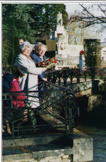
Une couronne de fleurs est lancée dans l'Yèvre lors du pèlerinage de Vierzon en 2003

Sachant que cette dernière puisait dans la prière et dans son rêve la force pour agir, nous faisons aux saintes de Carthage cette demande : sainte Perpétue et sainte Félicité, accueillez Solange dans la félicité perpétuelle ! Nous ajoutons cette pensée d'une carmélite portugaise, Maria-Perpetua, décédée en 1936 : "L'amour pur et l'amour désintéressé doivent vivre conjointement et