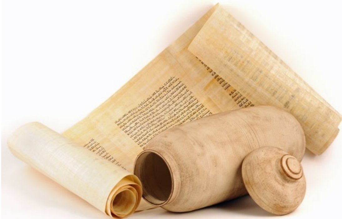
Manuscrits de la Mer Morte (Qumran)

site : http://fraternite-sainte-perpetue.com